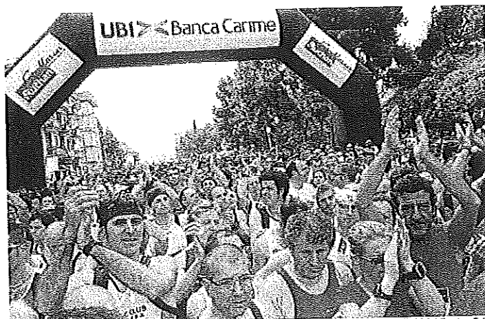
L'ALLEGRA MAREA Oltre diecimila, tra agonisti e non, hanno invaso le strade del centro per la 27ª edizione di Vivicit 