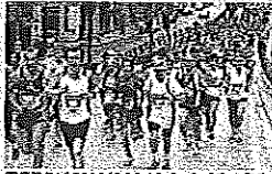
TRAGUARDO DELLE PAGINE DI CROCIAZIONE BARI >>>

Vivicittà, festa in 5.000 Caliandro dominatore Barì, ecco nomi e tempi di tutti i partecipanti