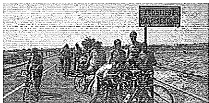
I ciclisti alla frontiera Mali/Senegal

DAKAR (Senegal), 24 febbraio 2010 - Centocinque chilometri, gli ultimi. Una sessantina per strade lungo il mare, lungo il deserto, lungo le palme, comunque lunghe. Quasi una cinquantina nell'immensa lercia densa bollente periferia e poi nell'immensa fitta odorosa rumorosa babele di Dakar. Due milioni di abitanti, un centinaio in bici ad aspettarci e accompagnarci fino all'ultima pedalata. E sono bici di tutte le taglie e età, vecchie signore e giovani rampanti, corsaiole e amatoriali. Un senegalese fora, si ferma, scende dalla bici (è una mountain bike), se la carica sulle spalle e insegue, disperato, lo sciame. Il silenzioso tour della solidarietà, organizzato dalla Uisp, appoggiato dal comitato Bici d'Italia in Africa e sostenuto dalla Fondazione Montepaschi di Siena, porta con sé il via da Bamako, dall'albergo della città, che è il municipio, come una festa, come un festival, come un revival.