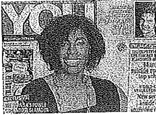
Mokgadi Caster Semenya, 18 anni

«Caster Semenya è ermafrodita». Lo scrive il tabloid britannico «The Sun» che cita una fonte interna alla Federazione internazionale di atletica. «Ora ne abbiamo una prova certa», ha affermato la fonte. Dopo lo scoop del tabloid britannico è arrivata anche la conferma dal New York Daily News che sarebbe riuscito a entrare in possesso dei risultati dei test. L'atleta rischia l'annullamento della vittoria dell'oro negli 800 metri al campionato del mondo. La IAAF dovrà prendere una decisione il prossimo 20 o 21 novembre.