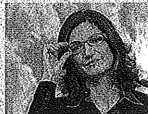
Mariastella Gelmini, 35