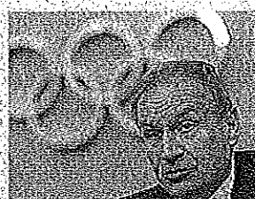
Gianni Petrucci, 63 anni

movimento nel confronti della scuola». Petrucci lamenta un grave ritardo nell'attuazione dell'obiettivo numero uno del Coni: l'introduzione dello sport nella scuola: «Il nostro Paese - continua Petrucci - che eccelle in molti settori, purtroppo nella classifica della presenza dell'attività motoria e sportiva a scuola è agli ultimi posti in Europa». Petrucci chiede a gran voce di «passare ai fatti», partendo dalle risultanze dell'incontro di gennaio e augurandosi che queste «possano essere messe al più presto all'ordine del giorno del Tavolo tecnico congiunto Miur-Coni».