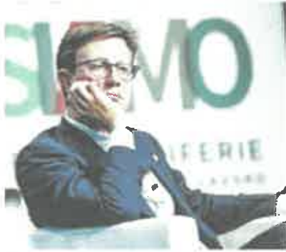
Il sindaco di Firenze D. Nardella

mostrano anche i colloqui avuti nelle ultime settimane con il sindaco di Bologna Virginio Merola e con il presidente della Regione Toscana, Enrico Rossi, che hanno sposato subito l'iniziativa. Non solo: lunedì Nardella incontrerà il governatore uscente dell'Emilia Romagna Stefano Bonaccini per iniziare un percorso condiviso.