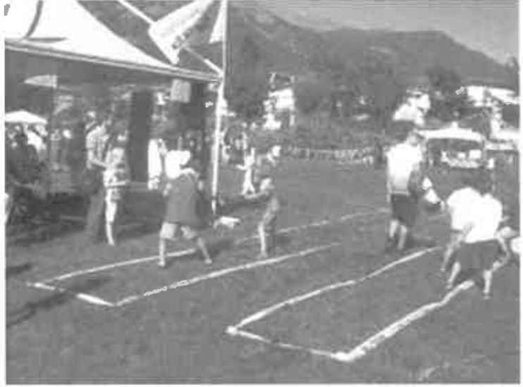
Un'edizione di Uispladi

Dare l'opportunità a tutti, ed in particolare ai più piccoli che potranno provare a cimentarsi nelle diverse attività sportive proposte e in giochi tradizionali come il tiro alla fune, la corsa nei sacchi e altri ancora, è l'obiettivo di Uispladi 2019, ma manifestazione ludico sportiva promossa dalla Uisp.