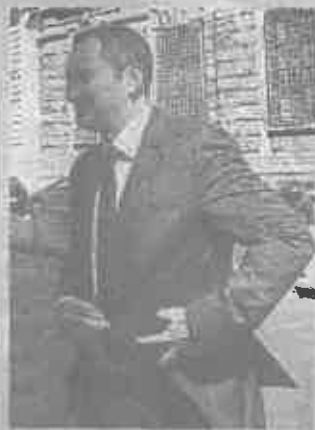
Nuovo Vincenzo Spadafora, 45 anni neo ministro per lo sport

M a quale sarà l'agenda «sportiva» del nuovo governo? Alla domanda si risponde con fatica. La parola sport, infatti, a differenza di quanto accadde con il contratto Lega-5 Stelle, non compare nel programma. È il ritorno al ministero dello Sport, cioè all'era Gentiloni-Lotti, prima che Giorgetti assumesse la delega da sottosegretario alla presidenza del Consiglio, è una tela con colori tutti da scoprire visto che il dicastero è senza portafogli. Mentre per i due sottosegretari si fanno i nomi del 5 Stelle Simone Valente (già nel precedente esecutivo) e della PD Patrizia Prestipino, di certo oggi il ministro Vincenzo Spadafora affronterà il primo esame: la «partita» dei 60 milioni in più per lo sport, inseriti nella