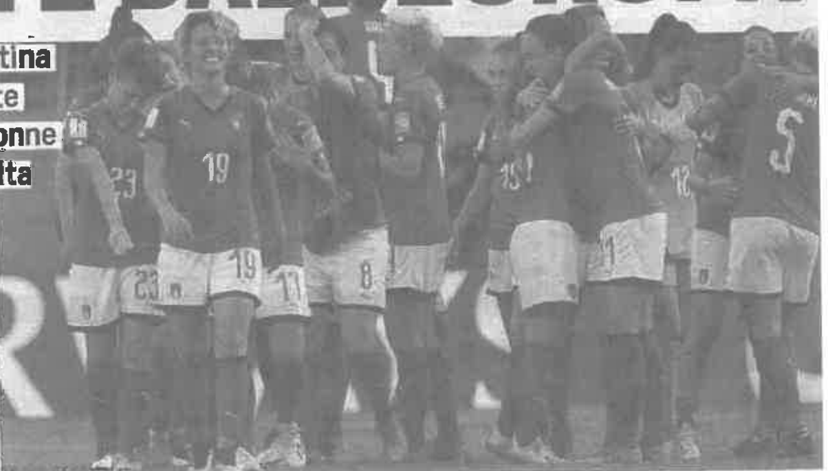
La Nazionale italiana femminile di calcio durante l'ultimo Mondiale, disputato in Francia

CHAMPIONS. Stasera (20.30) al Moccagatta di Alessandria) ad alzare il sipario sarà la Juventus, impegnata in Champions League contro le vice-campionesse d'Europa in carica del Barcellona (da quattro anni il trofeo lo vince l'Olympique Lionne), mentre domani (ore 19, al Franchi) la Fiorentina sfiderà l'Arsenal. L'obiettivo è quello di fare più strada possibile in un torneo che - da quando è stato istituito nel 2001 - non ha mai visto un'italiana in finale. Il divario con il resto d'Europa è ancora significativo: l'anno scorso la Juve uscì ai sedicesimi contro il Brøndby e la Fiorentina agli ottavi, eliminata dal Chelsea.