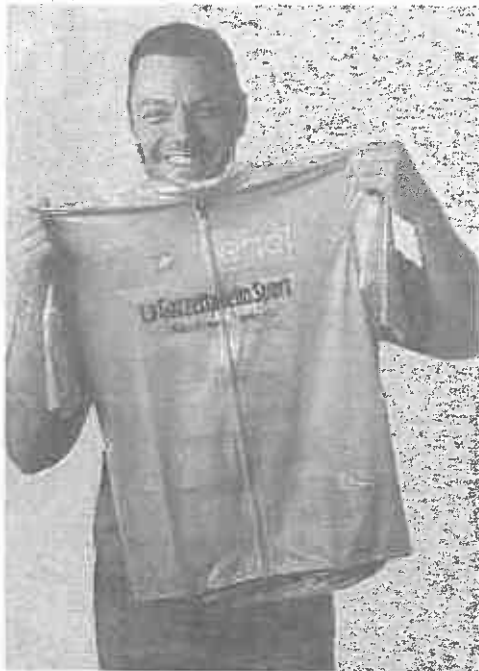
In rosa Tiziano Ferro con la maglia rosa del Giro. Il cantautore sarà ambasciatore di Save The Children

«È inaccettabile — spiega Ferro — che ci siano bambini cui ogni giorno vengono ne-