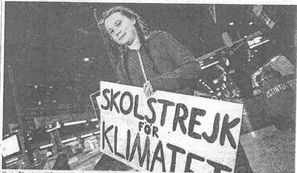
Greta Thunberg, 16 anni, all'arrivo alla stazione di Milano