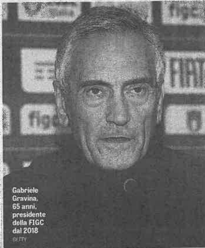
Gabriele Gravina, 65 anni, presidente della FIGC dal 2018

EQUILIBRIO È la parola chiave della gestione Gravina. Equilibrio nell'introduzione di nuove licenze nazionali, nella riforma del processo sportivo, nel restyling del Club Italia. Il sistema sta cambiando, il sistema cambierà. A cominciare dalle regole di ingaggio. «A dicembre abbiamo pubblicato il nuovo sistema delle licenze, ma è solo un assaggio - spiega -. Nel prossimo Consiglio federale (il 2 aprile) introdurremo nuovi indicatori che ridurranno l'effetto di certe alchimie contabili. Questa è una materia in continua evoluzione, non fai in tempo a varare una norma che hanno trovato il modo di aggirarla. Certe situazioni di sofferenza, penso ad esempio al caso del Palermo, ci amareggiano, ma siamo convinti che già dalla prossima stagione ci sarà una selezione migliore». E chi entrerà pur senza averne i mezzi, «alla seconda rinuncia a scendere in campo, non più alla quarta, verrà messo fuori».