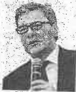
● Giancarlo Giorgetti, 52 anni, esponente della Lega e sottosegretario alla Presidenza del Consiglio dei ministri con delega allo Sport