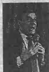
Giancarlo Giorgetti, sottosegretario allo Sport

● «Firmeremo quando le Regioni e le città candidate si assumeranno l'impegno formale di farsi carico dei costi». L'aveva detto Giancarlo Giorgetti mercoledì mattina a chi chiedeva notizie sull'impegno del governo italiano su alcune «garanzie» (non economiche) in termini di sicurezza, dogane e rispetto dei diritti umani. Detto fatto, arrivato il sì degli enti locali, il governo Conte ha firmato e inviato la documentazione. E