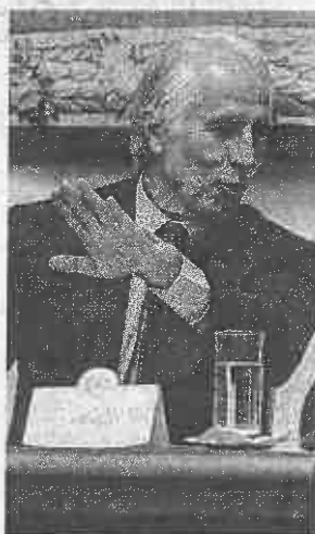
Giovanni Malagò, n.1 Coni

P orta quotidianamente sempre spunti nuovi il caso Coni-Governo. Giovanni Malagò da una parte, Giancarlo Giorgetti e l'altro sottosegretario Simone Valente dall'altra: oggi si vedranno nuovamente per cercare di trovare punti di incontro sulla nuova riforma dello sport italiano. «Se la riforma resta così — ha dichiarato ieri il n.1 del Coni presente all'evento «Lo sport italiano: passato, presente e futuro» presso PalestraMusia — se le cose non cambiano, me ne vado un secondo dopo la fine delle Olimpiadi di Tokyo 2020 (il mandato scadrebbe nel 2021; ndr). Li incontrerò proprio al Coni, negli ultimi giorni i toni sono molto più