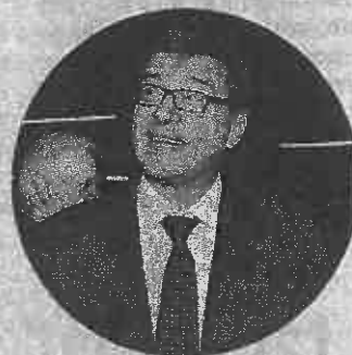
Giancarlo Giorgetti, 51