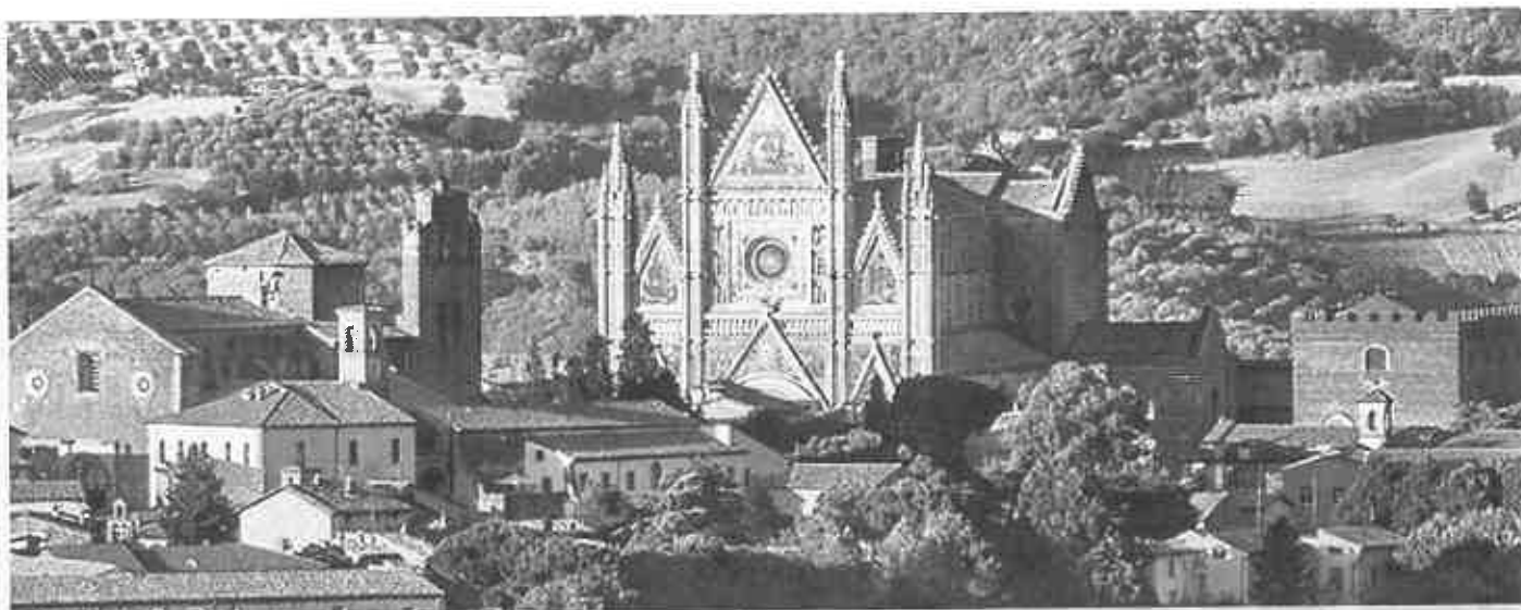
Orvieto con bambini

Nelle vie di Orvieto sarà possibile giocare a: scacchi, dama, carrom, biliardino, burraco, flipper, tennis tavolo, nala, twister, memory, gruviera, rimbalzino, delirio, barattoli, damigiana, tubo, noci, chiodi, anelli, going, ferri di cavallo, jenga gigante, costruzioni di legno, aquiloni, carrioli, modellismo radiocomandato, tiro alla fune, pista biglie, birilli, hula hop, corde, mini tennis, tiro con l'arco, giochi di ruolo e simulazione, giocoleria, braccio di ferro, ruzzola e tanto altro!