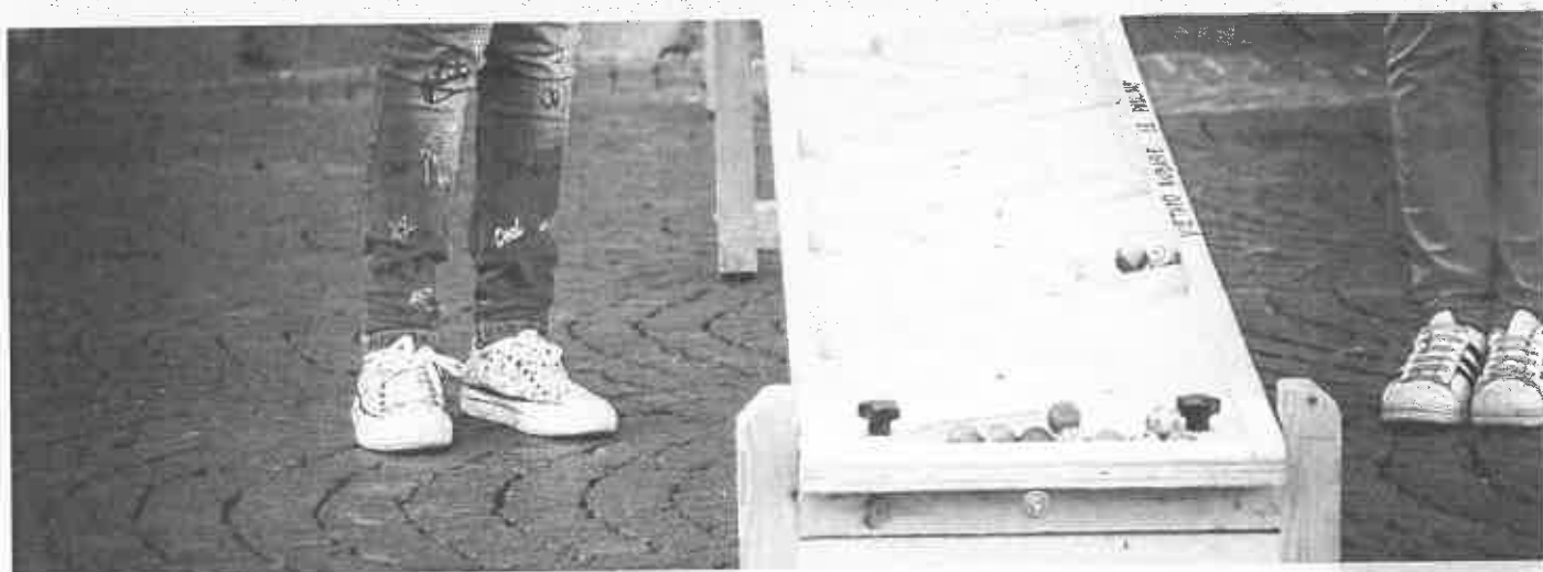
Festival Nazionale del Gioco e delle Tradizioni di Orvieto – Foto @Simone Mescolini

La manifestazione orvietana dedicata ai bambini e al gioco si aprirà il 21 settembre nel Palazzo del Capitano del Popolo, in pieno centro storico. La mattina ci saranno convegni sul tema del gioco tra passato, presente e futuro, si parlerà di videogiochi ed il loro impatto nel mondo ludico, di sport e molto altro. Nel pomeriggio Orvieto diventerà un Paese dei Balocchi e le sue piazze diventeranno la sede di attività di gioco e laboratori per i piccoli visitatori e le loro famiglie.