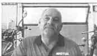
Passione e visione romantica, Ciabini: "Ecco come è nata questa avventura"