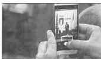
XXII° Premio Internazionale Fair Play Menarini: Valdichiana protagonista della tre giorni