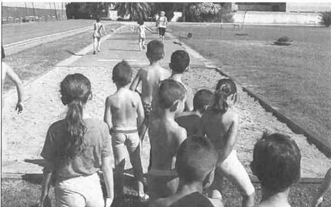
Attività sportive al campo Coni

Ieri alle 12:06 - ultimo aggiornamento alle 13:23