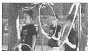
Sport in piazza Premio Fair Play 2018