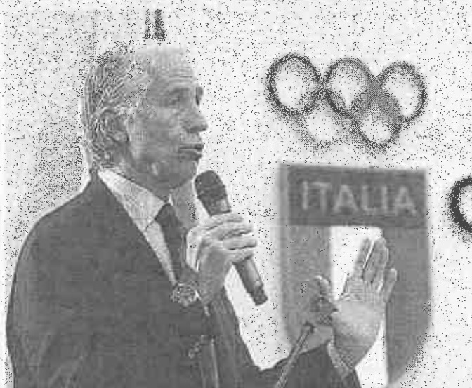
Giovanni Malagò, 59 anni, è presidente del Coni dal 2013

C' è ancora in piedi una soluzione «italiana», insomma un tentativo di mettere insieme le tre aspiranti candidate per conquistare l'organizzazione dei Giochi olimpici invernali 2026. Fra il no categorico di Torino, la freddezza di Cortina, il «sì ma solo con noi capofila» di Milano, reputata internazionalmente più forte, il tempo corre. Visto che ieri Malagò ha cancellato anche l'ultimo dubbio: «Si deciderà nel Consiglio nazionale del 1° agosto. Ho già comunicato la cosa al sottosegretario Giorgetti, e