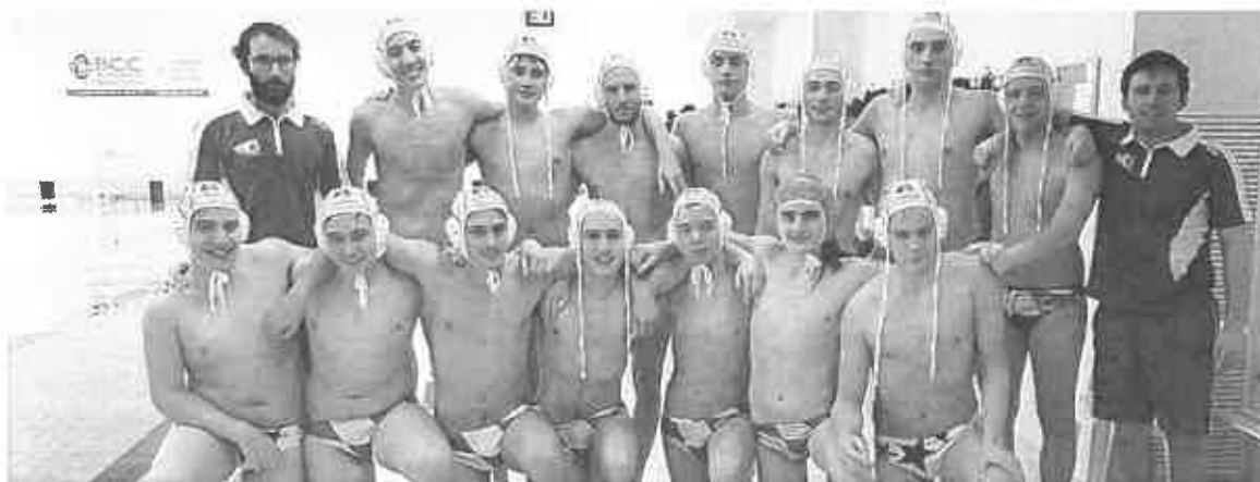
La squadra di pallanuoto Under 17 della stagione sportiva appena conclusa