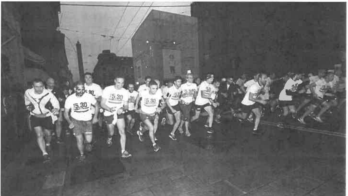
Lo scatto iniziale della Run 5.30

“ E alla fine - dice proprio Santi - nello spirito goliardico di questa iniziativa, colazione all'americana con fagioli, uova, salsiccia e pancetta ”. E il caffè, bollente, come digestivo. Anche questa è la Run 5.30 che, per la prima volta, all'ombra delle Due Torri, grazie all' Uisp , si è sposata nel migliore dei modi con la Paddle 5.30.