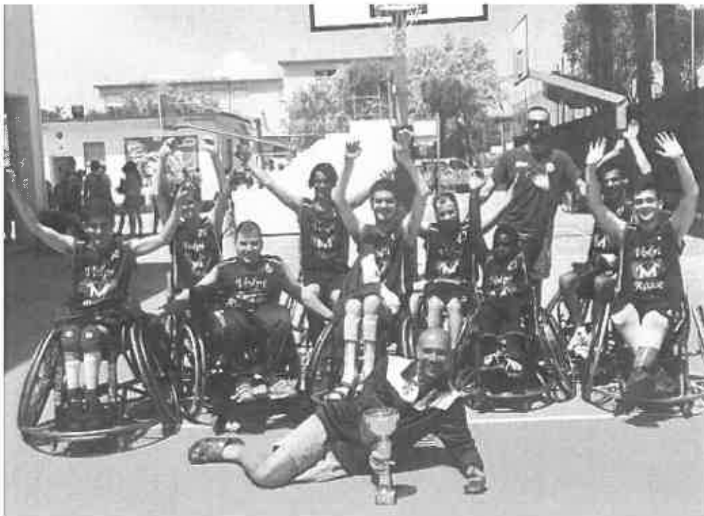
Basket in carrozzina, Volpi Rosse Menarini campioni nazionali dell'UISP

Venerdì, 08 Giugno 2018 18:14 Scritto da Davide Lacangellera dimensione font - +