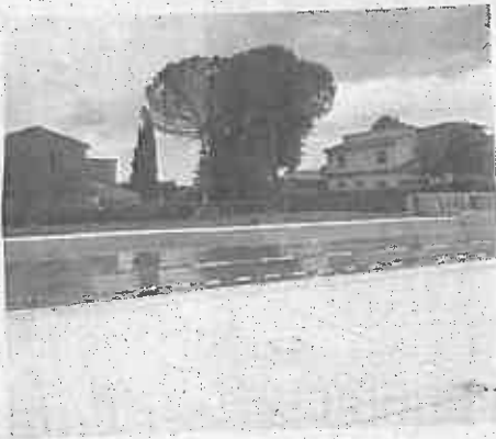
Domani l'inaugurazione. La piscina di Pianella ristrutturata pronta ad aprire