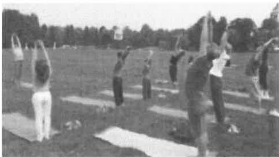
Personne fanno ginnastica in un parco: a Legnago partono i corsi