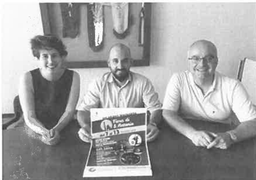
di Davide Soattin

Settimana di festa a Vigarano Mainarda per il patrono. L'assessore Berselli: "Grazie di cuore ai volontari"