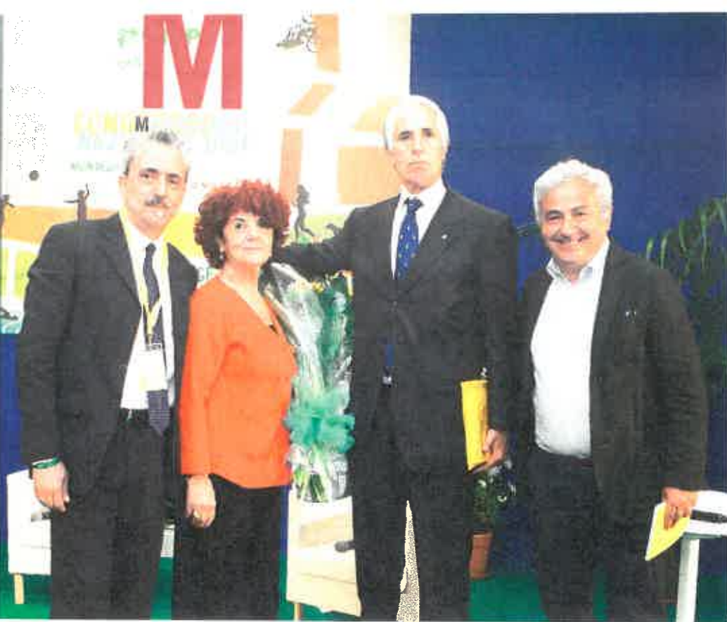
Manco con la Ministra dell'Istruzione, Valeria Fedeli, e Giovanni Malagò

I have a very critical opinion of the EPS (Sports Promotion Bodies) at this particular moment