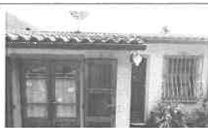
Rustico, Casale Seravezza Frazione Pancola, Via Giustagnana, n. 1494 - 179750

Tribunale di Livorno Tribunale di Pisa Tribunale di Lucca Tribunale di Grosseto