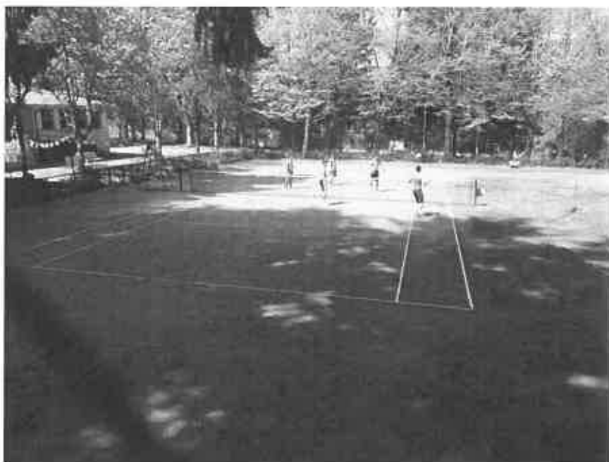
Colle San Marco

E lo fa con una proposta unica nel suo genere, molto coinvolgente ed innovativa, che si pone l'obiettivo di far conoscere meglio e rivalutare il nostro territorio