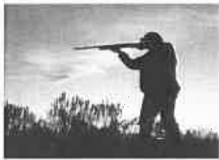
BUSSETO, CACCIATORE IMPORTUNA UNA BARISTA. DENUNCIATO