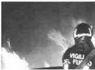
MONCHIO. DOMATO INCENDIO ALL'ISOLA ECOLOGICA