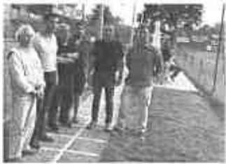
TENNIS CLUB. RICCO PIANO DI INTERVENTI