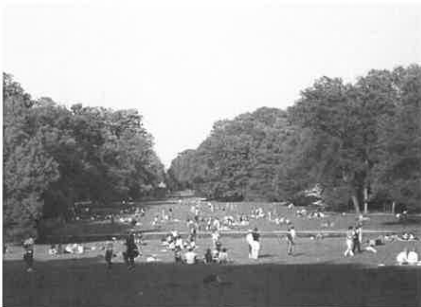
International Parks Festival

International Parks Festival, sport e natura dal 18 al 20 maggio a Trezzo sull'Adda: il programma