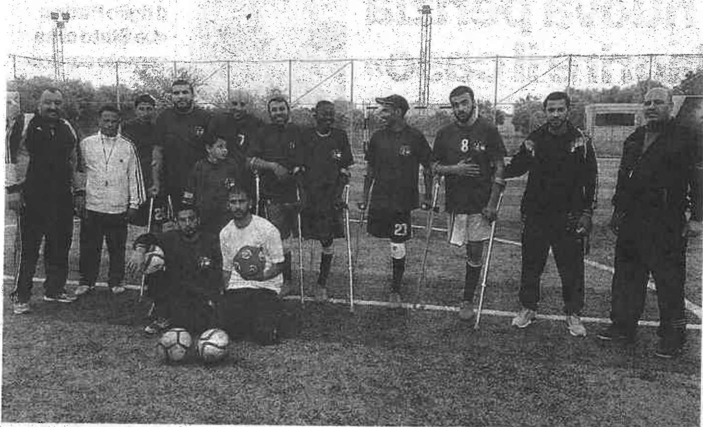
La squadra di calcio di disabili di Gaza, tutti ragazzi (compreso l'allenatore) a cui è stata amputata una gamba