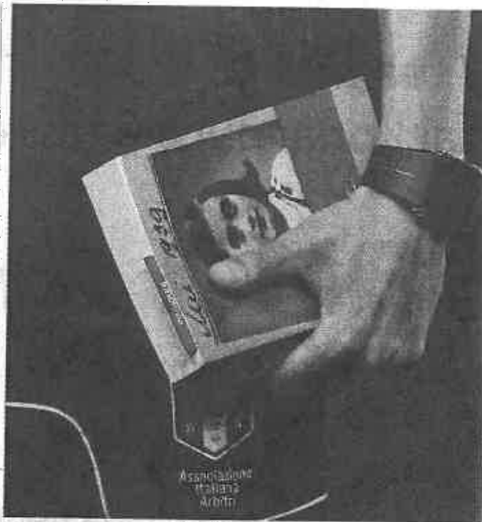
Il libro Un arbitro con il Diario di Anna Frank, che è stato letto negli stadi