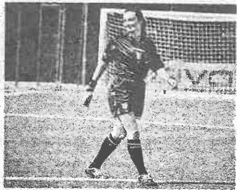
La giovane arbitra romana in campo

E qui finisce la cronaca sportiva (in attesa delle decisioni del giudice) e inizia il solito resoconto sulla mentalità sessista, difficile da scalfire in ambienti in cui il maschilismo impera. Così l'Itri, che affida a un comunicato la sua versione dei fatti, definisce l'arbitra «inadeguata». E pur affermando che a lei vanno