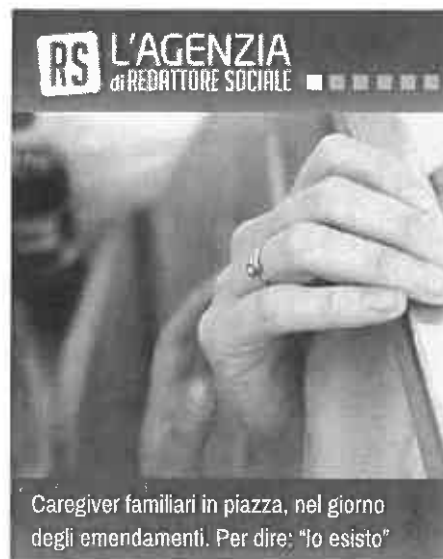
Caregiver familiari in piazza, nel giorno degli emendamenti. Per dire: "Io esisto"