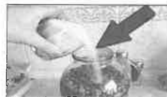
Addio alla pancia! Ho perso 42 kg in 1 mese bevendo a stomaco vuoto...