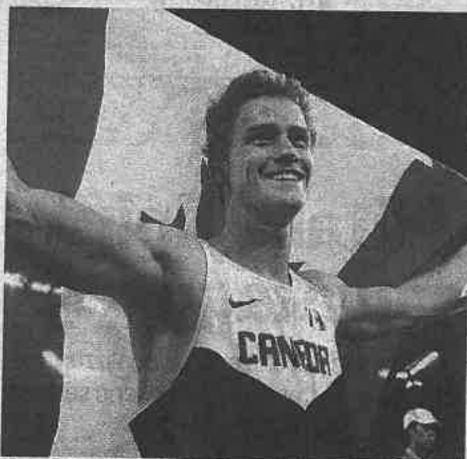
Shawn Barber, 22 anni, oro mondiale dell'asta a Pechino 2015

S altare oltre ogni pregiudizio. E ricadere su un saccone soffice come la propria coscienza serena. Shawn Barber è il campione del mondo del salto con l'asta, il ragazzo che fece disperare «le roi» Renaud Lavillenie ai Mondiali di Pechino di due anni fa, sfilandogli un oro annunciato. Su Facebook si è liberato, ha trovato il coraggio per alzare il velo sulla propria sessualità con un coming out che nel mondo dell'atletica non ha molti precedenti: «Sono gay e ne sono orgoglioso!», il messaggio lanciato dalla sua bacheca con la tranquillità di chi è pronto per non nascondersi più. «Continuo a crescere come persona — scrive il 22enne —. Ringrazio i miei genitori per essermi così di supporto. Ai miei