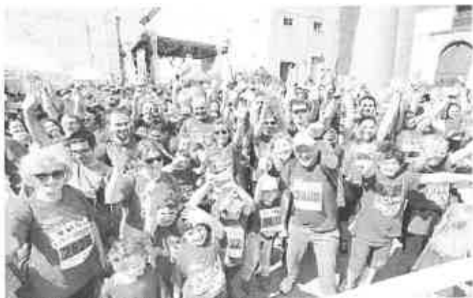
Un'immagine della StraGenova dello scorso anno.

L'itinerario della Family Run, che l'anno scorso ha riscosso un grandissimo successo offrendo la possibilità alle famiglie di partecipare con il sorriso all'evento, è un percorso da 4,5 chilometri da vivere al ritmo che più si preferisce. Con partenza da piazza de Ferrari alle 9.50, l'itinerario si snoderà per via XX Settembre, che per l'occasione