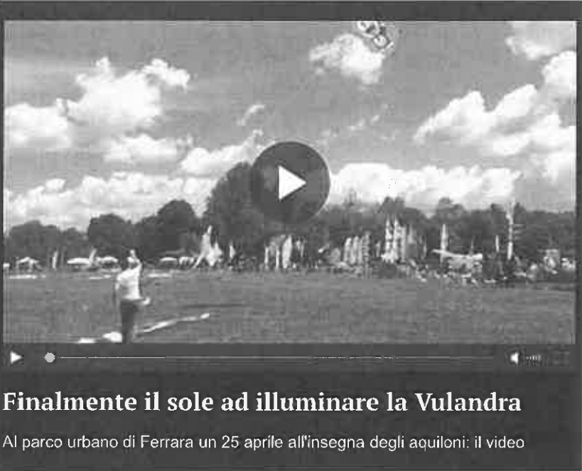
Finalmente il sole ad illuminare la Vulandra Al parco urbano di Ferrara un 25 aprile all'insegna degli aquiloni: il video

FERRARA. Torna l'appuntamento con Vulandra, il Festival Internazionale degli aquiloni, al Parco urbano Bassani, a Ferrara, nel mese di aprile. Quest'anno la manifestazione si svolgerà dal 22 al 25 aprile, e sarà come sempre un'occasione per invitare ferraresi e turisti a godersi le giornate all'aperto in compagnia degli ospiti aquilonisti, provenienti da tutto il mondo, ammirando i colori e le forme bizzarre dei loro aquiloni, un mix di raffinata ingegneria aerea e fantasia.