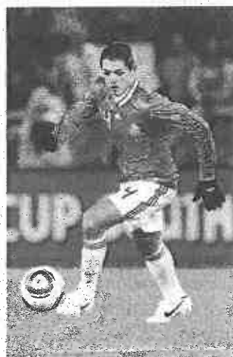
Javier Hernandez con la maglia del Messico

SENZA SOTTOVALUTARE anche il quadro d'insieme sul quale si è innestata la notizia della candidatura a tre per la Coppa del Mondo in programma tra nove anni. Intanto è arrivata mentre Trump punta a rinegoziare il Nafta, l'accordo di libero scambio tra i tre Paesi. Ma è soprattutto il Muro piazzato tra i confini statunitensi e il Messico, quell'ammasso di filo spinato e poca tolleranza e rispetto per la principale forza - lavoro non americana a pesare parecchio sull'appeal di Trump sugli americani. Un fattore che potrebbe rendere accidentato il percorso all'accettazione del ticket Usa - Canada - Messico. Anche se The Donald non sarebbe presidente in carica nel 2026, pure nella (sciagurata) eventualità che gli americani lo accreditassero di un secondo mandato.