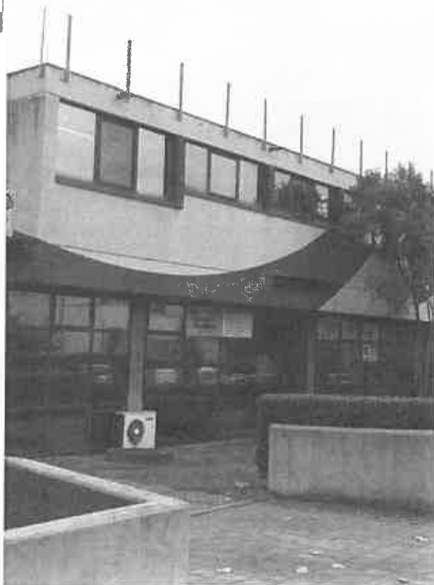
Il palazzetto Balestri

ROSIGNANO. Da domani le tre palestre di Rosignano Solvay Picchi, Balestri e Volpi saranno gestite da associazioni sportive del territorio. Sono infatti state affidate in gestione dal Comune di Rosignano (Decreto n. 729 del 30 marzo) a seguito della manifestazione di interesse scaduta il 27 marzo scorso.