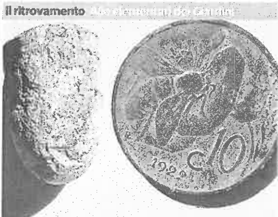
Fortuzzi, nel giardino spuntano dei reperti

Seguire le partite e magari qualche talento nascosto fra i banchi del liceo sarà semplice: sulla pagina Facebook verranno postate le foto delle partite, ma anche gli highlights di ogni match con le azioni più belle. La finale poi godrà addirittura della diretta. Ogni riferimento al liceale che 80 anni fa giocava a calcio ai Prati di Caprara, Pier Paolo Pasolini, non casuale: «Ci piace ricordare a chi critica il calcio, che presenta tanti difetti ma ha anche il pregio di unire classi sociali, culture diverse e insegna a giocare per il bene collettivo e non per il singolo, che è un gioco amato anche da persone colte e intelligenti, come Pasolini».