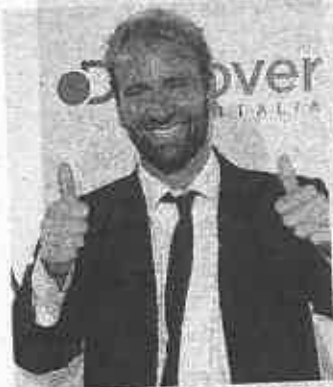
Massimiliano Rosolino