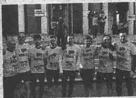
La squadra di Norcia alla Corsa di Miguel