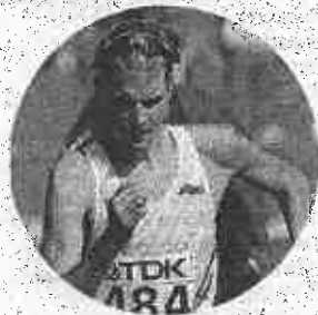
Alex Schwazer, 32 anni

● C'è da aggiornare la lista dei record italiani: la IAAF, per violazione delle proprie regole antidoping, ha infatti depennato l'1h17'30" centrato da Alex Schwazer nella 20 km di marcia il 18 marzo 2012 a Lugano. Il provvedimento fa riferimento al punto 32.2 (A) delle «Competition Rules» 2016-2017, ovvero alla «presenza di sostanze proibite o ai suoi metaboliti nella provetta dell'atleta», ma è pure possibile che sia da mettere in relazione alle motivazioni della sentenza del 22 dicembre 2014 del Tribunale di Bolzano che, in sede penale, condannò Schwazer a otto mesi per l'ammissione di assunzione tra il marzo 2010 e il luglio 2012 anche di Epo e testosterone. Il primato resta dell'altoatesino: con l'1h18'24" ottenuto nella stessa località svizzera il 14 marzo 2010.