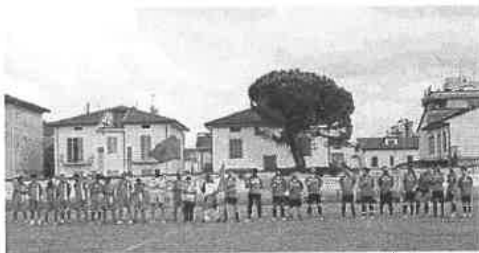
Le squadre marocchina e italiana prima della finale

L'ITALIA contro il resto del mondo in una due giorni di giochi e solidarietà a Fucecchio. Anche per quest'anno è andato in scena allo stadio Corsini il Torneo dei Popoli, una serie di incontri di calcio fra giovani giocatori delle varie comunità straniere presenti sul territorio comunale.