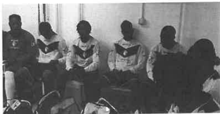
La squadra del Pagi composta da richiedenti asilo del Sud Sahara

Realtà calcistiche alternative provengono anche dai team composti unicamente