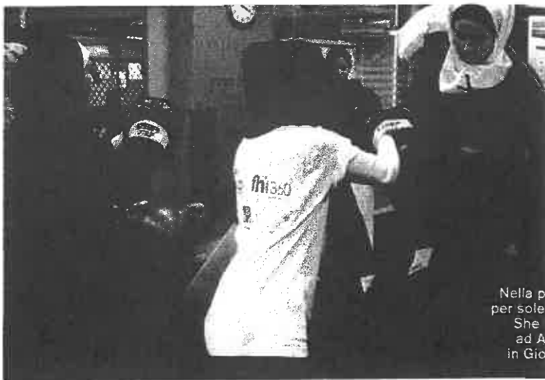
Nella pa per sole She F ad A in Gio