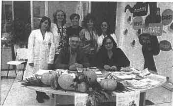
La presentazione dell'Obesity Day

21 ottobre 2015 16:02 Sport Empolese Valdelsa