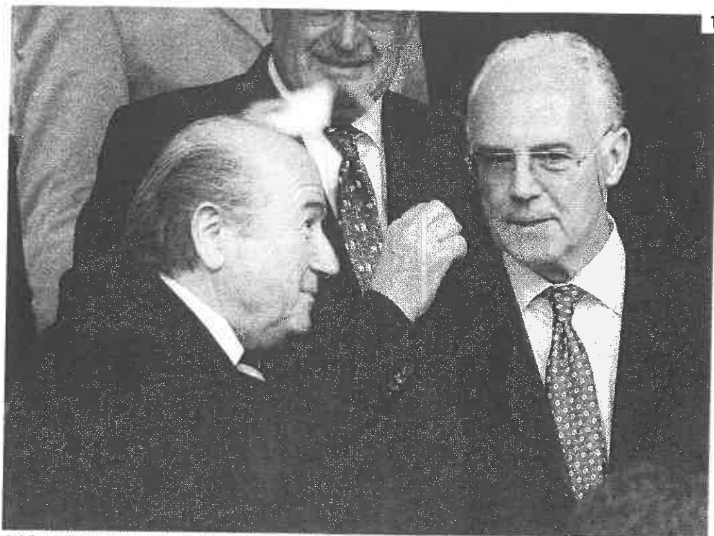
● 1 Sepp Blatter, 79 anni, presidente Fifa dimissionario, e Franz Beckenbauer, tedesco, vicepresidente Fifa tra il 2007 e il 2011 ● 2 Angel Maria Villar Llona, presidente della Federcalcio spagnola e vicepresidente Uefa e Fifa ● 3 Michel Platini, 60 anni, francese, presidente Uefa e candidato alle elezioni Fifa