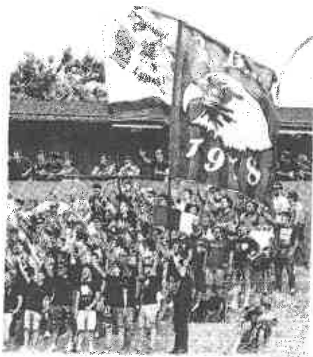
I tifosi dell'Aquila Calcio, club di Lega Pro