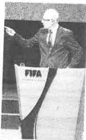
Beckenbauer, 70 anni