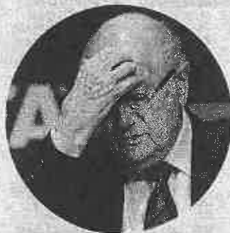
Sepp Blatter, 79 anni