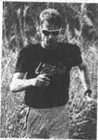
Alex Schwazer, 30 anni

ROMA. Alzata l'asticella, Alex Schwazer non ha tremato. Marciando sui 20 km romani di un circuito ricavato tra auto, motorini, cani (al guinzaglio) e su un pessimo asfalto, l'altoatesino ha stampato un grande 1h18'57": sarebbe il sesto tempo al mondo nel 2015, 18" me-