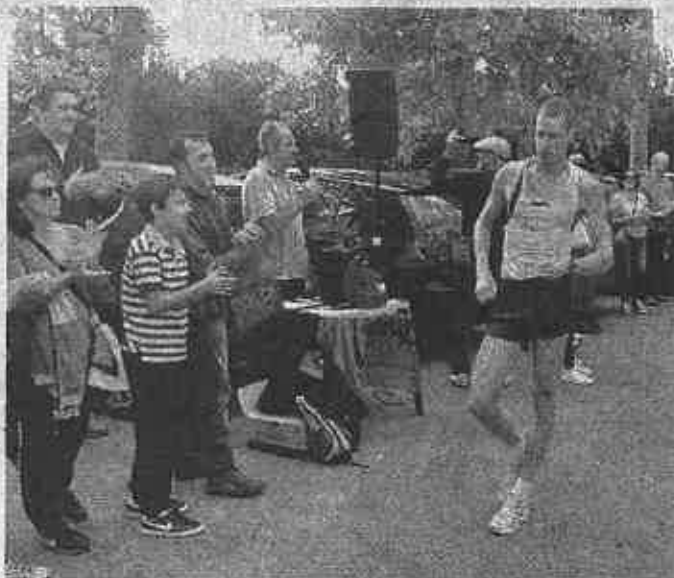
Alex Schwazer, 30 anni, ha vinto le Olimpiadi 2008 nella 50 km

TRIBUNALI E lei? Lei naturalmente non c'è, loro non si sentono e non si vedono da una vita. Eppure caso, destino o giustizia sportiva, fate