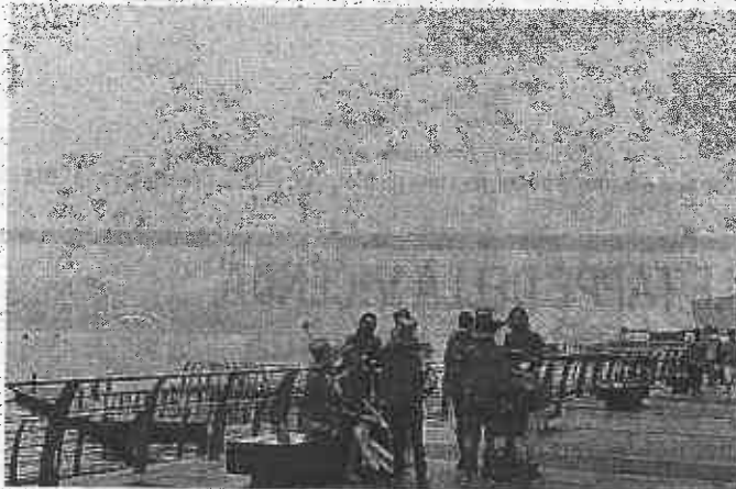
Singapore oscurata dal fumo. Sotto, l'ungherese Katinka Hosszu con la mascherina e gli incendi che devastano Borneo e Sumatra

S cene di straordinaria pericolosità, per poter respirare in acqua e fuori. Scene di caos, ieri, a Singapore: tutti al riparo, niente finali alle sei del pomeriggio, biglietti rimborsati e delusioni e polemiche per la tappa di Coppa del Mondo in vasca lunga all'aperto. Nonostante da due settimane il livello di inquinamento dell'aria fosse salito, per effetto soprattutto degli incendi nella foresta indonesiana, le gare erano state confermate. Soltanto venerdì, la Fina aveva cominciato a prendere precauzioni (inizialmente annullati 800 e 1500) per gestire il problema dello smog, di quei nuvoloni grigi provocati sul cielo dal fuoco di chi cerca di impossessarsi dei terreni per nuove coltivazioni. Gli organizzatori avevano avvertito i nuotatori che se il livello di inquina-