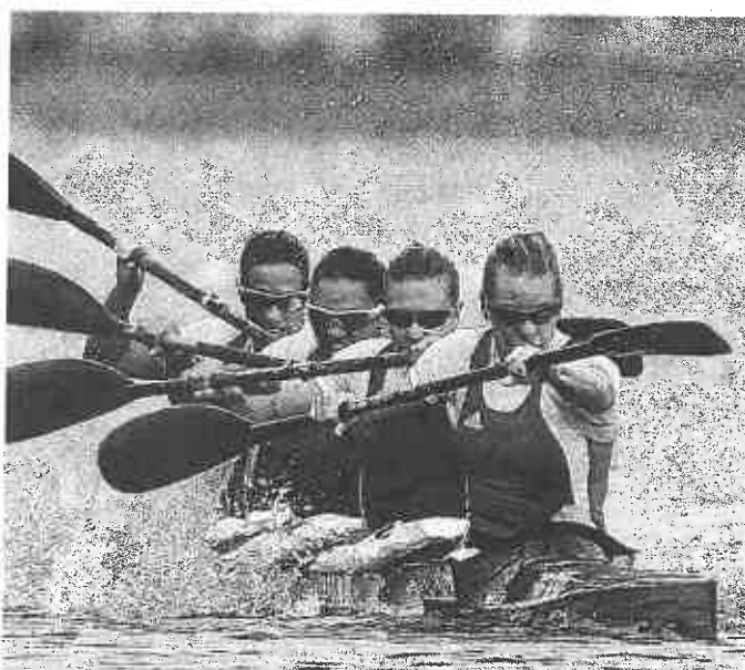
Il K4 donne dell'Ungheria nella finale dei 500 della canoa velocità ai Giochi di Londra 2012. Fu uno dei sette ori dei magiari

C' è pure Budapest. La capitale ungherese si è iscritta ieri alla corsa per organizzare le Olimpiadi del 2024. La lettera inviata al Cio dal sindaco Tarlos e dal presidente del comitato olimpico Borkai, è stata spedita a poche ore dal sì del Parlamento, con 151 voti a favore, 33 contrari (socialisti e verdi) e 4 astenuti. Un sì pronunciato nella stessa giornata dell'approvazione del contestatissimo (anche dall'agenzia Onu per i rifugiati e da Amnesty International) «muro anti-immigrati» al confine con la Serbia. Non proprio un bel biglietto da visita internazionale per il governo guidato dall'ex calciatore Viktor Orban. Comunque, ora le can-