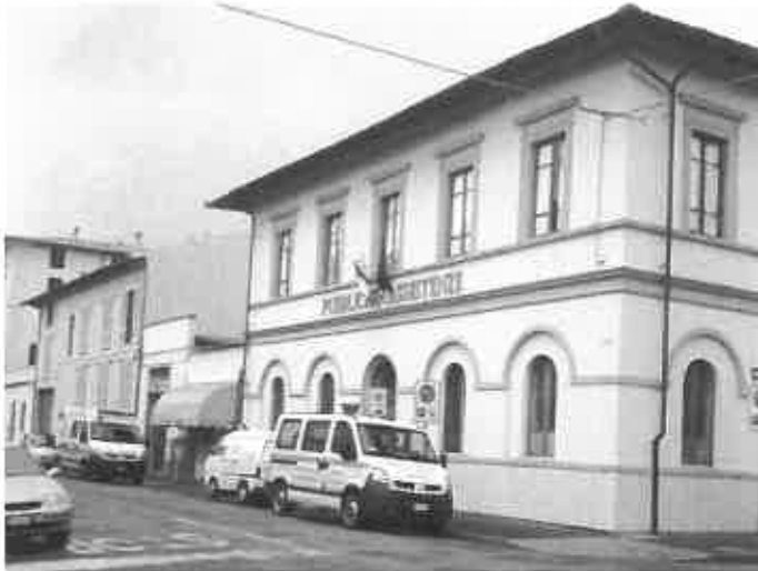
La sede delle Pubbliche Assistenze Riunite di Empoli