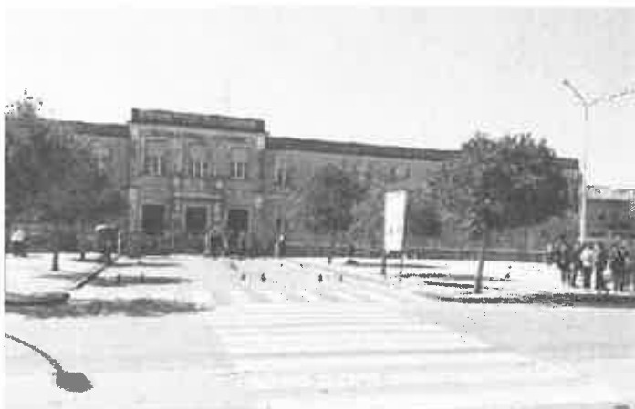
L'esterno della scuola media statale «Capuana» di viale Lido

La restante somma di circa 100 mila euro, pari al 10 per cento del costo totale, sarà a carico del bilancio comunale. Il vecchio edificio