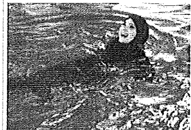
In piscina in burkini