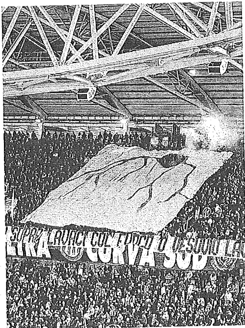
Lo striscione esposto dai tifosi della Juve prima della partita col Napoli: «Ridiamoci sopra. Lavaci col fuoco o Vesuvio lavaci col fuoco» L'APRESSE

Gruppi «politici» «Risultano attivi 388 gruppi ultrà, composti da 41.120 supporters -