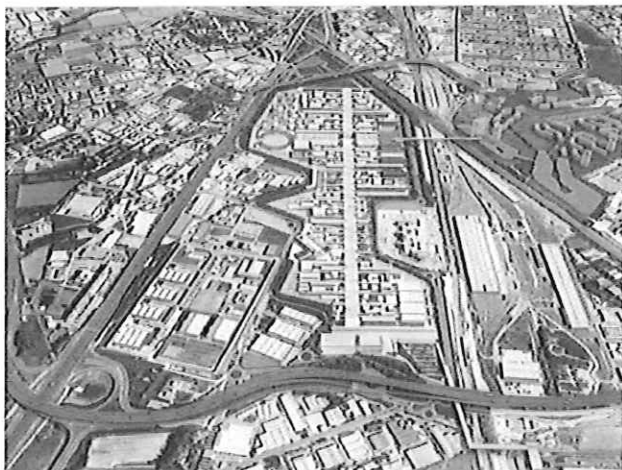
L'area dell'Expo2015 che comprende anche la Cascina Triulza