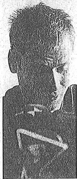
Alex Schwazer, 28 anni

fettuato un primo aggiornamento dell'elenco RTP nazionale in cui il Coni ha recepito varie proposte di aggiornamento della Fidal, effettuate con varie comunicazioni.