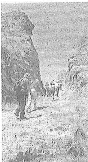
Alcuni dei partecipanti alla camminata

In seguito gli escursionisti, hanno raggiunto il sito delle Terme di Bruciarello, dove esiste una struttura purtroppo in stato di abbandono ma dove, comunque, è possibile utilizzare liberamente i fanghi e le docce con l'acqua calda mineralizzata sulfurea. In tale località vi sono, inoltre, numerosi laghetti di origine vulcanica detti "Laghi" o "Avis" (dal latino che