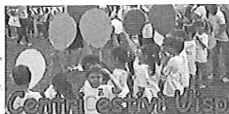
Anche quest'anno tante proposte per le vacanze dei bambini