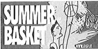
Torna il torneo itinerante di pallacanestro 3 contro 3