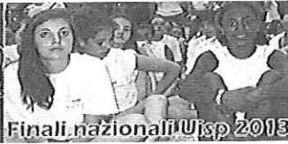
Al via la stagione delle finali per Leghe e Aree di attività Uisp