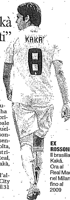
EX ROSSONERO Il brasiliano Kakà. Ora al Real Madrid, nel Milan fino al 2009

Pare al momento ancora più complesso arrivare all'altro obiettivo della campagna milanista: per Balotelli il City vuole 37 milioni. E il tempo stringe: il mercato chiude il 31 gennaio, a poco più di tre settimane dalle elezioni.