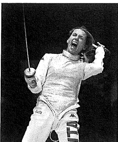
Valentina Vezzali si presenta alle nuove elezioni

Mancano poche settimane alle elezioni politiche e le coalizioni hanno stilato le liste dei candidati. Anche in questa tornata elettorale è cospicua la rappresentanza del mondo dello sport. Storica la presenza di Rivera, le new entry sono Vezzali e Idem