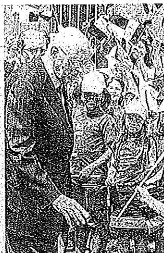
Il presidente Napolitano accolto dai bambini durante una visita

La Lega contro E così, dal prossimo anno scolastico, tra i banchi di scuola i ragazzi saranno costretti a imparare tutto l'in-