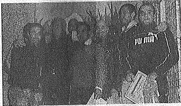
A sinistra i reclusi che hanno partecipato al corso da arbitro, promosso da Mauro Manfrin della Uisp. Sotto alcuni dei premiati durante la cerimonia avvenuta martedì. Per tutta l'estate nella struttura di piazza Don Soria si è giocato a tennistavolo, biliardino e calcio a 5