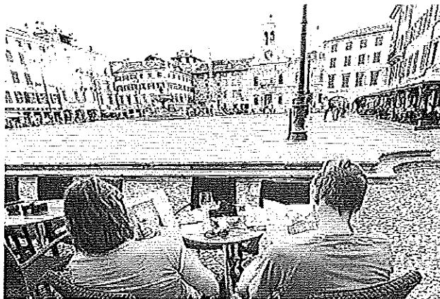
L'Ecorientering approderà anche in piazza San Giacomo

Quasi trecento ragazzi delle scuole medie e superiori cittadine sabato 6 ottobre invaderanno il centro di Udine per una sfida di orientering molto speciale. Non solo dovranno destreggiarsi tra lo spazio urbano, in una sorta di caccia al tesoro, ma dovranno anche saper rispondere alle domande di logica, matematica, cittadinanza, storia e cultura locale.