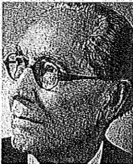
In alto: Philip Noel-Baker sul traguardo dell'Olimpiade di Anversa (1920) dove si classificò secondo nel 1500. Sopra in età matura, scrittore e statista

muni. Fra il 1945 e il '51 fu ministro, operando in diversi settori importanti. L'Enciclopedia Britannica lo definisce «fluido in sette lingue». Molti i suoi scritti, il più famoso dei quali, nel 1958, fu «A Programme for World Disarmament». Che un anno dopo gli valse appunto il Premio Nobel per la Pace. C'è da notare un fatto curioso, relativo al suo nome. Era nato come Philip John Baker, ma in seguito chiese ed ottenne di abbinare al suo cognome quello della moglie, Noel. Philip John Noel-Baker morì a Londra, appunto l'8 ottobre 1982, all'età di quasi 93 anni.