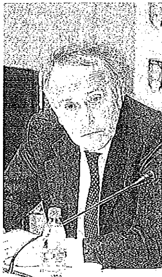
Giancarlo Abete, presidente Figo

Responsabilità oggettiva «Le regole vanno rispettate, per il futuro possono essere migliorate com'è stato fatto per i fenomeni di violenza dove le società che hanno dimostrato di essersi attivate per garantire che non accadano certi episodi, vengono sanzionate in maniera diversa o assolte del tutto — spiega Abete ai cronisti —. Per le situazioni in essere non può non valere la norma esistente, senza dimenticare che il principio della responsabilità oggettiva è un principio cardine dell'ordinamento sportivo». «Lo scandalo del calcio ha colpito e non sappiamo come finirà — ha detto Petrucci - Sono realista, mi aspetto quello che c'è scritto sui giornali. Però la mia