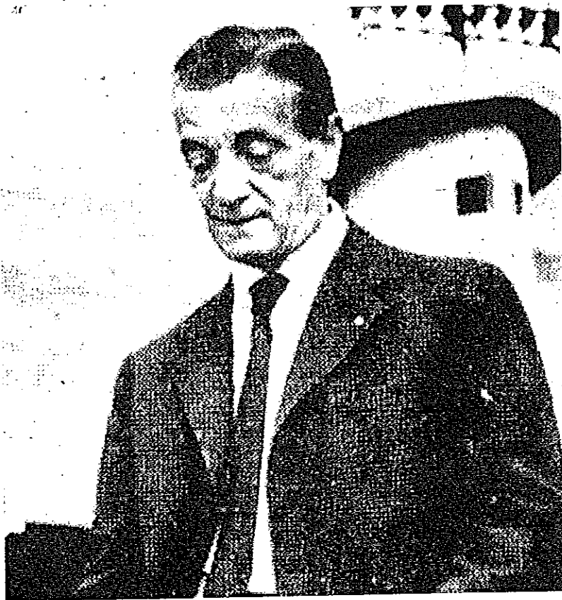
Renato Cesarini, giocatore e allenatore di Argentina, Italia, River Plate, Juventus, Napoli

I suoi gol inventarono la "Zona", dove si può invertire il destino La sua vita è un libro messo in scena a Pesaro e a Buenos Aires