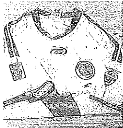
Una maglia per tre Paesi

P ochi mesi fa, la tensione in America Latina era altissima: l'esercito colombiano aveva bombardato un accampamento Farc in territorio ecuadoregno; il presidente dell'Ecuador Correa aveva espulso l'ambasciatore di Bogotá e rinforzato militarmente i confini; il Venezuela, coinvolto in successive accuse di connivenza